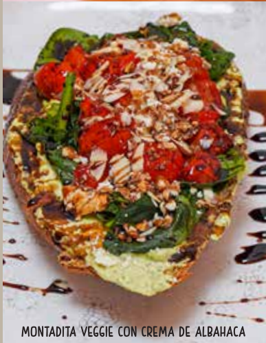
MONTADITA VEGGIE CON CREMA DE ALBAHACA