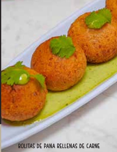
BOLITAS DE PANA RELLENAS DE CARNE